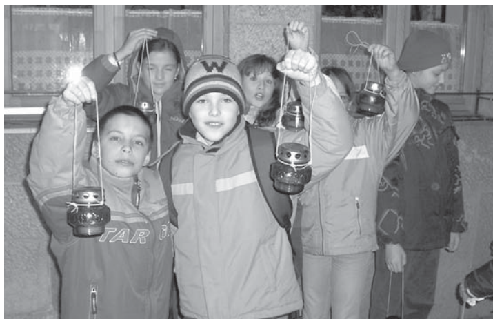
A 4. a osztály a Bölcs Bagoly műveltségi vetélkedőn 7. lett

December 18-án délután közös ajándékkészítéssel készülünk az ünnepre. December 19-én, ünnepváró hangulatban kerül sor az iskolai ünnepélyre, a közös gyertyagyújtásra.