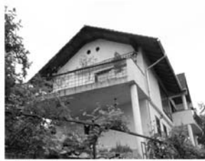
Táborhegy csendes utcájában panorámás 1500nm-es telken bővíthető, 240nm családi ház 89M 06 70 456 1030