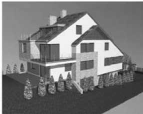
III. Erdőalja úton, 5 lakásos társasházban lakások leköthetőek! 06 70 456 0030