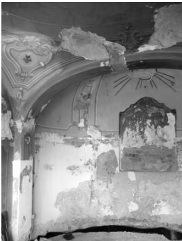
Szentélyrészlet a restaurálás előtt

A templom hátralévő külső munkáira úgy tűnik valahogy meg lesz a költségfedezet. A belső restaurálás azonban pénz híján elmarad. Az elektromos huzalok és szerelvények korszerűsítése ugyan megtörtént, a padlóburkolatot még magunk csak meg tudjuk csinálni, de a díszítőfestés restaurálása komoly kiadást jelent.