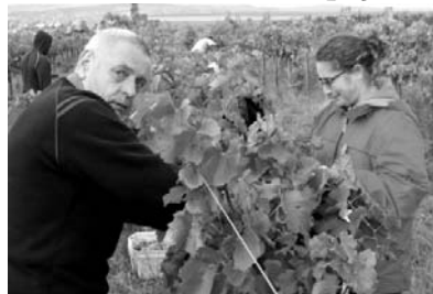
Ők nem vágják meg egymás ujját