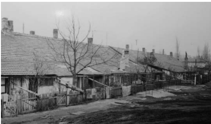
Lakások az Újlaki Téglagyár területén, a gyár bezárása napján, 1973. december 30.