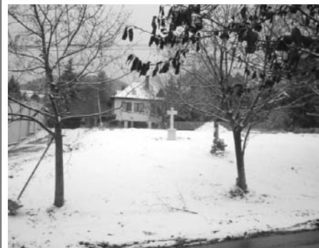
Az út felé megnyílt Jablonka park a hó alatt