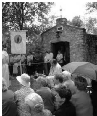
A derenki búcsú

A Torna-patak völgyében fekvő Körtvélyes környéke természeti érdekességben és táji szépségekben bővelkedő karsztvidék. E táj déli részét Aggteleki-karsztnak, északi részét Szlovák-karsztnak is nevezik tévesen, mert ez nem két különálló karsztvidék, hanem az egységes Gömör-Tornai karszt. A községtől nyugatra terül el a felszínalaktanilag gazdag Szilicei-fennsík, melynek egyik mély víznyelőjében jégbarlang találha-