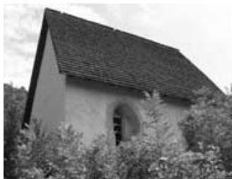
A körtvélyesi Szt. Anna kápolna