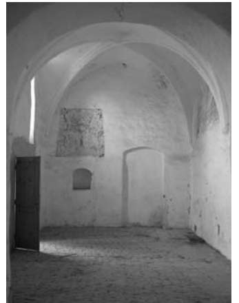
Az elhagyott kápolna hajója freskómaradványokkal