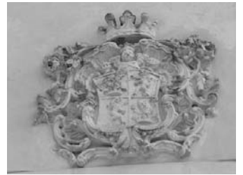
Nagyszőlős, a családi címer a Perényi-kastély ormán Kerkuska Zoltán felv.

1917-ig a Tisza-kormány belügyi államtitkára volt. A Tanácsköztársaság idején mint az ellenforradalmi mozgalmak egyik vezérének lefoglalták és bíróság elé állították, de 1919. aug.-ban kiszabadult. A második Friedrich-kormányban, 1919. aug. 15-től 1919. szept. 11-ig a belügyi tárcát töltötte be. 1920-tól a Magyar Nemzeti Szövetség orsz. elnöke. A frankhamisítás egyik főszereplője. 1927-től 1933-ig a komáromi, majd a szépsi kerület egy.-i képviselője, mandátumáról 1933-ban, amikor koronaórré választották, lemondott. 1939-től 1940-ig Kárpátalja kormányzó biztosa is volt. Mint koronaőr hivatalból a felsőház tagja, később alelnöke is.” E szócikkből kimaradt, hogy első elnöke volt a közreműködésével 1938-ban alapított Magyarok Világszövetségének.