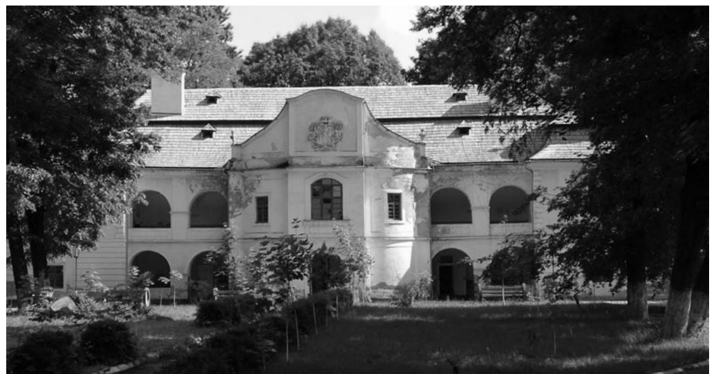
Nagyszőlős, a Perényi-kastély