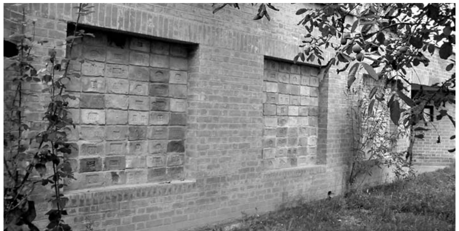
A Máramaros úti végállomás nevezetessége Baskó Ottó építész értékes téglagyűjteménye, amelyet az utcai téglakerítésének három mezőjébe épített be, a buszra várakozók örömeire. Az egyik mezőben legrégebbi, évszámozott magyar téglá látható. A XVII. századi darab a tapolcai kolostor leomlott falából származik.