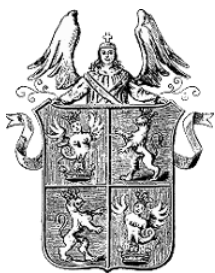
A Perényi család címere

Az említett Péterről meg kell említeni, hogy a családban ő az ötödik, aki ezt a keresztnevet viselte és ez olvasható még róla: „1519. temesi főispán és kapitány. Ebben az évben lesz koronaőr is, utóbb erdélyi vajda és Abauj vármegye örökös főispánja. A mohácsi csatá-