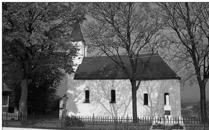
Perényi temploma