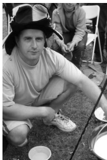
Kvárik Lajos, Mátyás kedvence