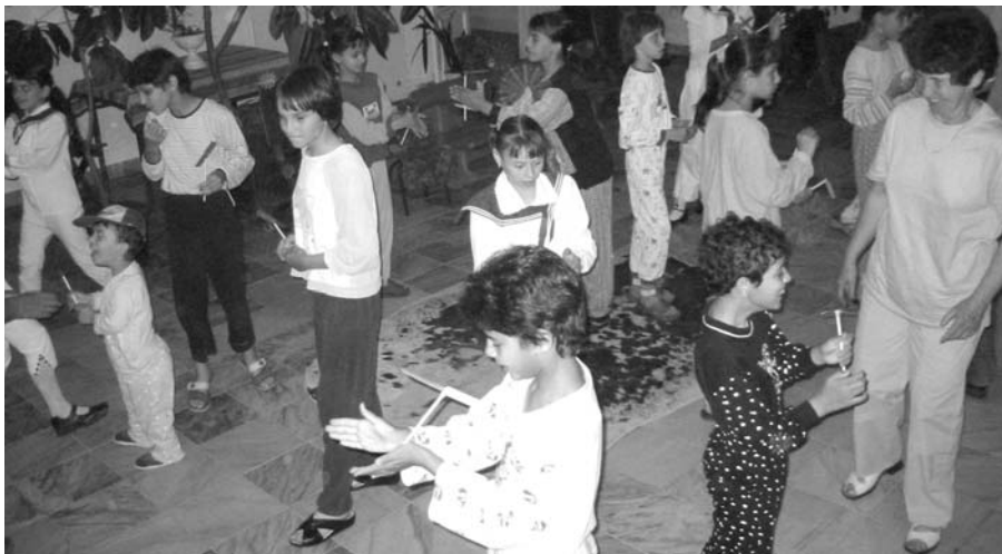
A pörgettyűk átvarázsolták át az otthon lakóit