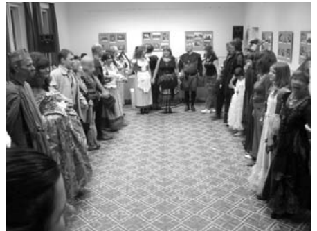
Kezdődik a táncoktatás