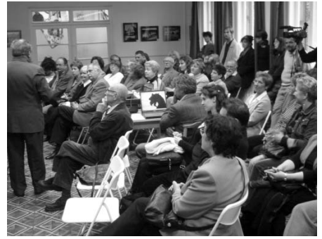
Vox Voluntatis hallgatósság