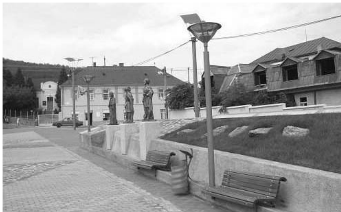
A Millenniumi tér