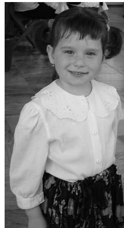
A kis táncos