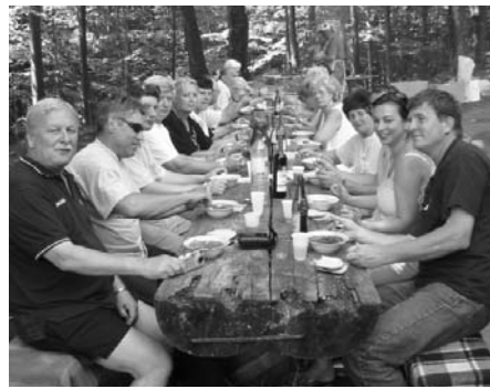
Ébéd az Aklos-hágónál