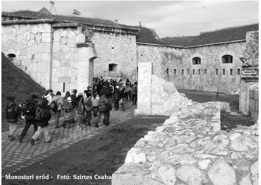
Monostori erőd

Iskolánk 55 éves, és 15 éve vettük fel II. Rákóczi Ferenc nevét. Úgy gondoltuk, hogy hagyó-