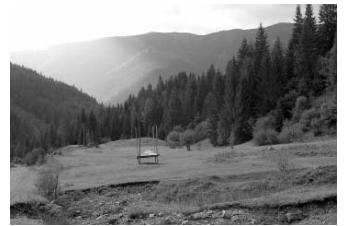
Az Ozeranka völgye, előtérben egy szénatároló abara, háttérben a Kamionka

Forr.: S. Benedek András szerk. „Itt élned halnod kell...”