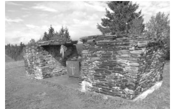
Verecke-hágó, a félbehagyott és megrongált honfoglalási emlékmű