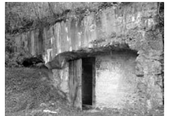
Felsőgereben, a földalatti fedezékrendszer pánccélajtaja