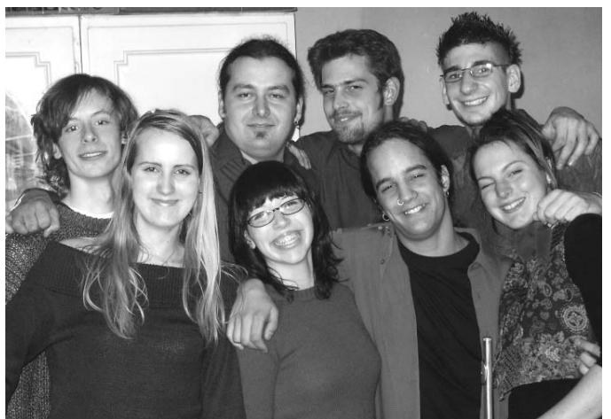
A „The Golden mean band” tagjai szórakoztatnak az Amazon Bálón