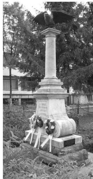
Dolha, a kuruc-emlékmű