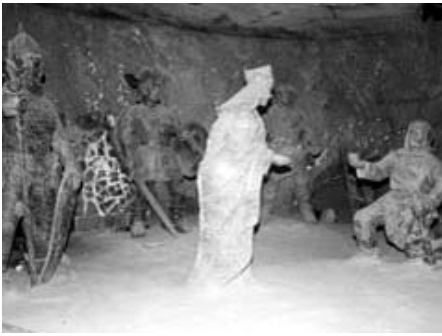
Szent Kinga sósobra a wieliczkaiban