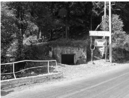
Osztrika, az Árpád-vonal „Линия Арпада” táblával jelölt fedezéke.

szok (ruszinok, rutének) több hullámban érkeztek. Ma javarészt a ruszinok hucul és lemkó népcsoportja lakja e vidéket, meglehetősen nehéz küzdelmet folytatva az őket nem létezőnek tekintő ukrán álladalommal. Hasonlóan nehéz körülmények között küzd a fennmaradásért a Tisza forrásvidékén élő magyarság. Rahó, valamint a Fekete-Tisza völgyében Kőrösmező és a Fehér-Tisza völgyében Tiszabogdány a jelentősebb szórványtelepülések. Máramarossziget a környékbeli szórványmagyarság központja.