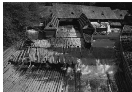
Vízfogó az Ozeranka völgyében

Tagányi Károly „Magyarország címertára” szerint „Máramaros vármegye 1748-ban kapott címet, melyet V. Ferdinand erősített meg 1837-ben. A tojásdad pajzs két részre van osztva. A felső rész ezüst mezején két zöld fenyőfa közt egy sziklás sóakna szája tátong elé, melyben két feketébe öltözött sóvágó csákánnyal kezükben áll egymással szemközt, míg az akna tetején jobbra fordulva egy zerge látható. Az alsó rész kék mezeje pedig a megyének négy folyóját – a Tiszát, Talabort, Nagyágat és a Visót – hul-