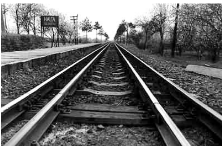
Fonódott vágányok Máramarossziget közelében.

A sószállító és hadiutak védelmére épült „Husznak romvára” szintén ismerős diákkorunkból. Huszt a máramarosi négy koronaváros központja volt, és a legenda szerint neve a másik három koro-