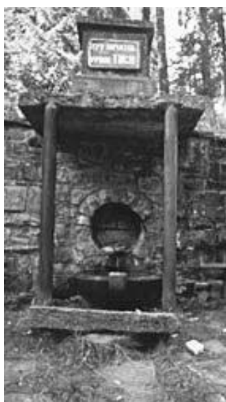
A Fekete-Tisza forrása

Máramaros a történelmi Magyarország észak-keleti határán, Gácsországgal és Bukovinával szomszédos táj, melynek területén a hasonló nevű vármegye létesült. E vidéken több ország igyekezett osztozkodni a legújabb időkig. A trianoni békeszerződés értelmében a vármegye dél-keleti fele Romániához, észak-keleti része pedig Csehszlovákiához került. Ez a rész a