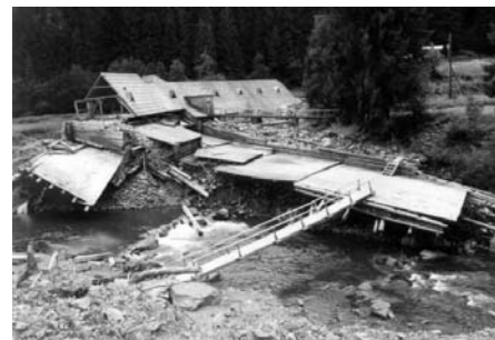
Az ozerankai vízfogó az árvíz rombolása után