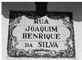
...és az ibériai félszigeten

Mit szólnának hozzá, ha mondjuk itt Óbudán, egyedi, a városrészeire valamilyen módon jellemző utcátáblákkal találkozónának egyik nap? Én nem hinnék a szememnek! Szerintem ez még az emberek hangulatát is jótékonyan befolyásolná.