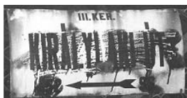
Utcatábla a hegyen...

Persze tudom, ez nem olcsó mulatság, és annyi minden, ennél sokkal fontosabb és égetőbb dolgra kell a pénz. De mégis jó lenne... (Miért is szabadkozom? Hiszen egy éjszakai ügyelet kihívásánál éppenséggel életet is