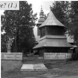
Toronya, ruszn fatemplom

Kiss Lajos „Földrajzi nevek etimológiai szótára” c. munkája szerint első említése 1700-ból való, Toronya alakban. Nevét a közeli Turopatakáról nyerte, melynek ma Torunka a neve. A szerző szláv eredetű névként tartja, melyben a tulok jelentésű „tur” szó rejlik. A mai Toronya névalakra hatással volt a magyar torony főnév is.