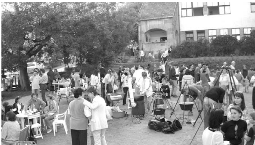
Beszámoló a 10. oldalon