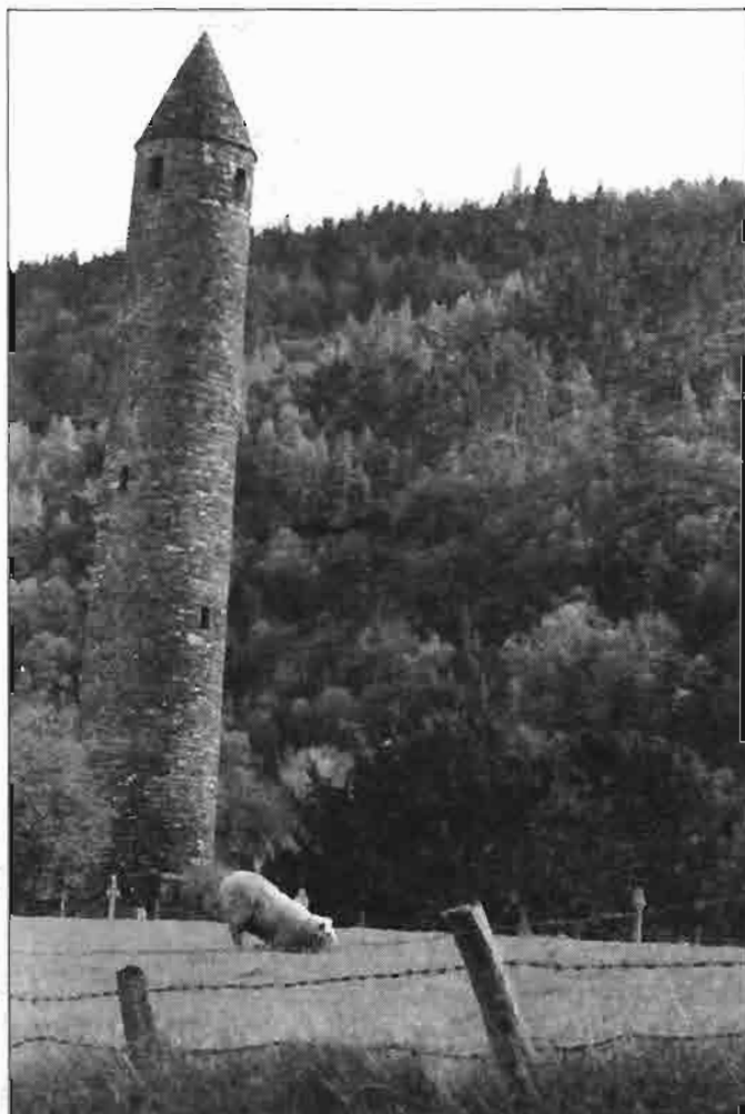
A glendalough-i kerek torony

A 9. sz. végén a vikingek taktikát változtattak: elkezdtek kereskedelmi központokat létesíteni