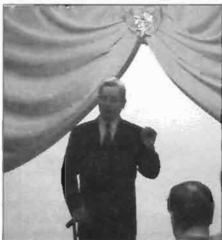
Tarlós István polgármester