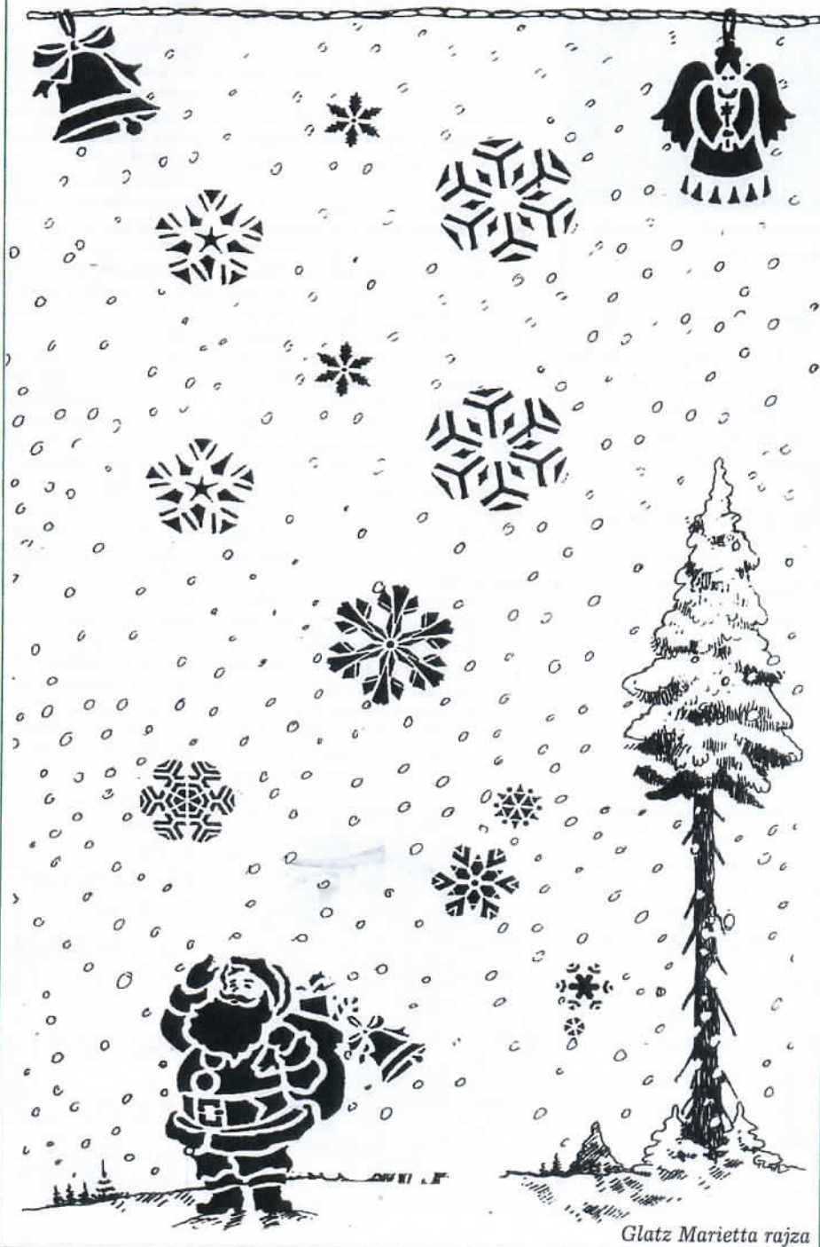
Glatz Marietta rajza

Kellemes karácsonyi ünnepeket és boldog új évet kívánunk kedves Olvasóinknak!