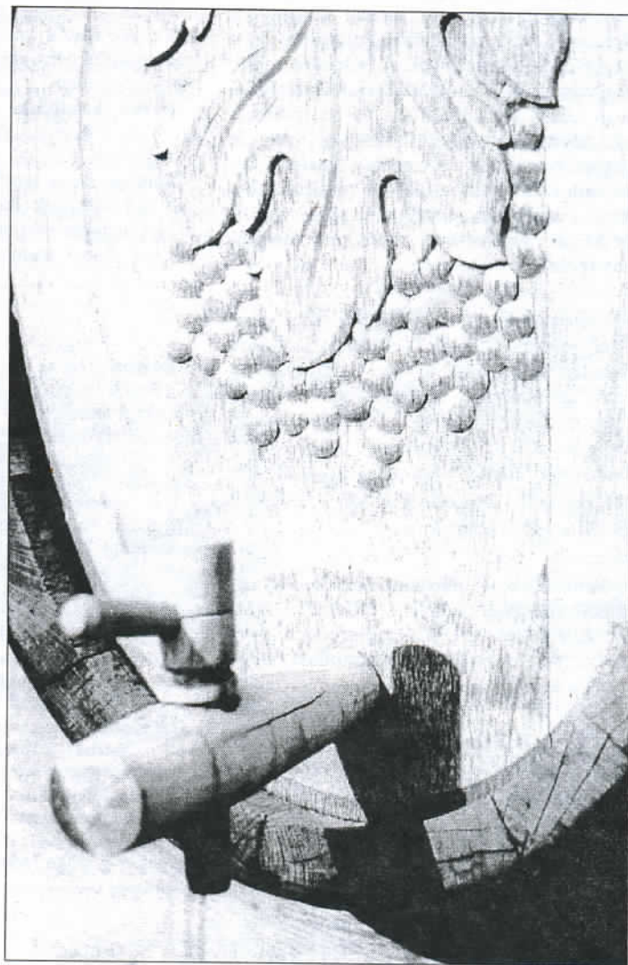
Szüreti cikkünk a 6. oldalon.