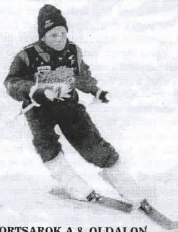
(SPORTSAROK A 8. OLDALON)